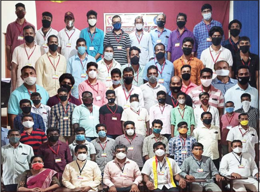
SAHRUDAYA COVID WARRIOR BELTHANGADY DIOCESAN COVID VICTIM TASK FORCE