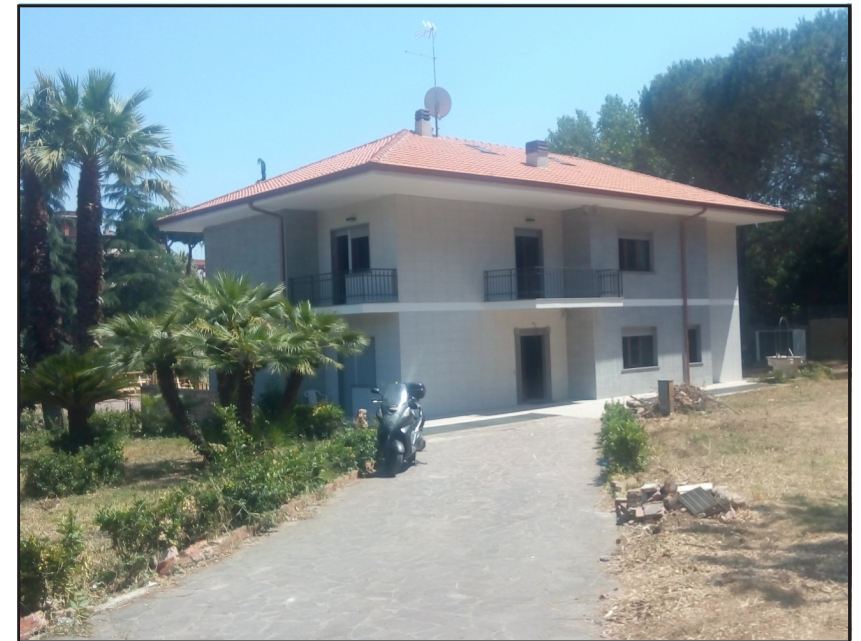
Blessing of the Syro Malabar Procura, Rome