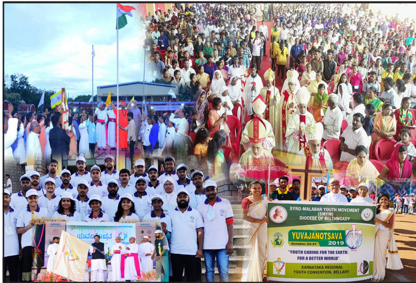
Yuvajanotsava 2019 - Bellary