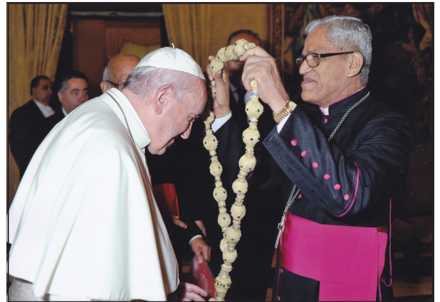
Ad Limina Visit 03. 10. 2019