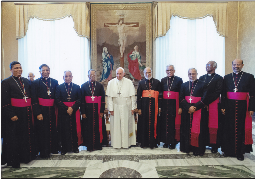
Ad Limina Visit 03. 10. 2019