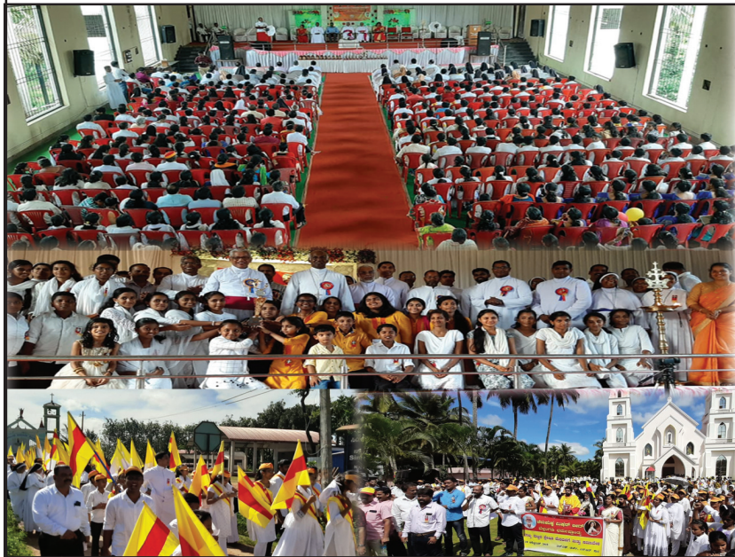
CML State Convention-2019, N.R. Pura