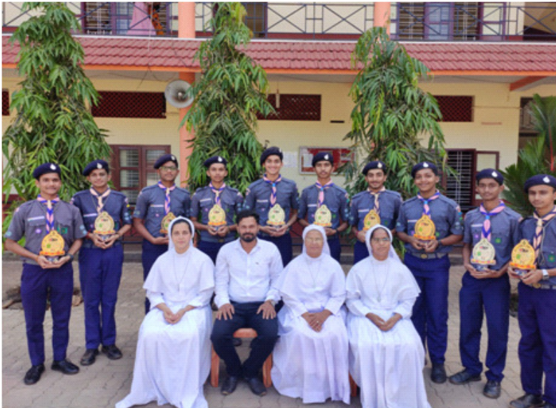
The Scouts Students of St. Mary's School Laila, Belthangady passed the National Level Examination of Scouts. It's first time in the history of Belthangady Taluk, Students pass National Level Scouts.