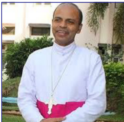
Bishop of Kanjirapally