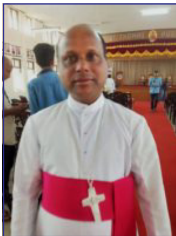
Newly Elected Bishop of Palghat