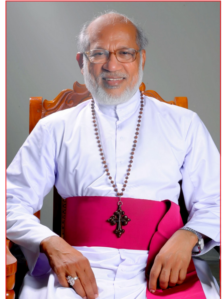
His Beatitude Mar George Cardinal Alencherry